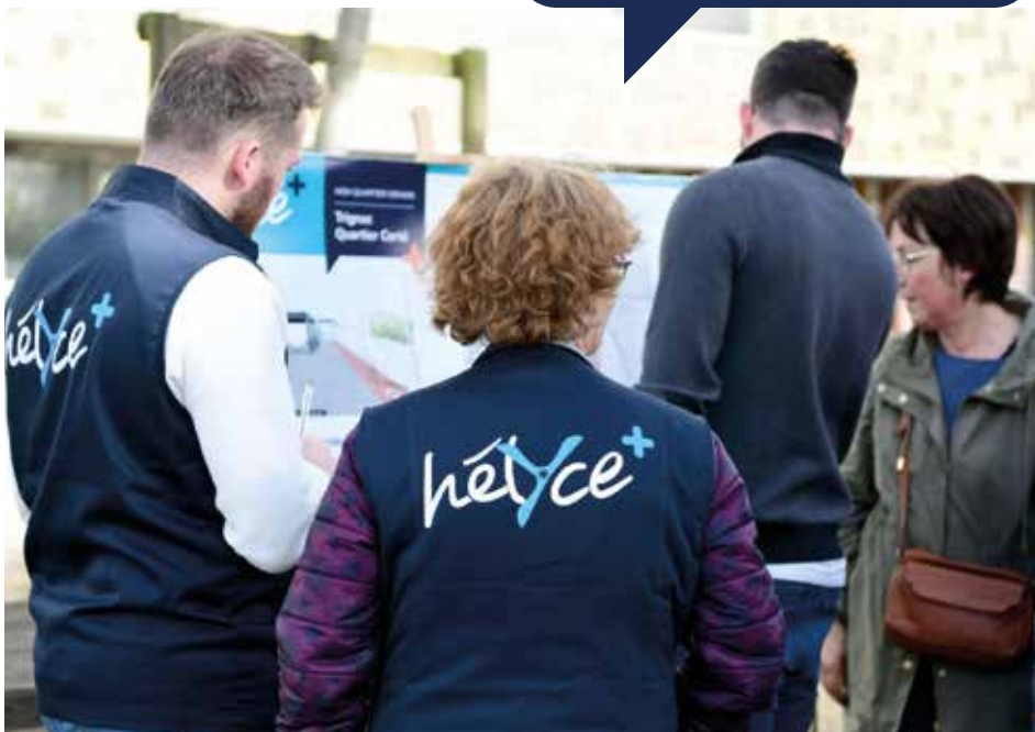
croquis et image de synthèse © Osty et associés • Impression : La Nouvelle Imprimerie 44350 Guérande SEMISE • 1746 - Saint-Nazaire Agglomération - la CARENE - Janvier 2024