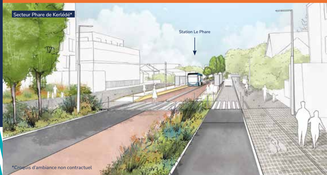
*Croquis d'ambiance non contractuel

Les informations seront disponibles sur le site internet helyceplus.fr et à travers des flyers distribués dans les boîtes aux lettres.