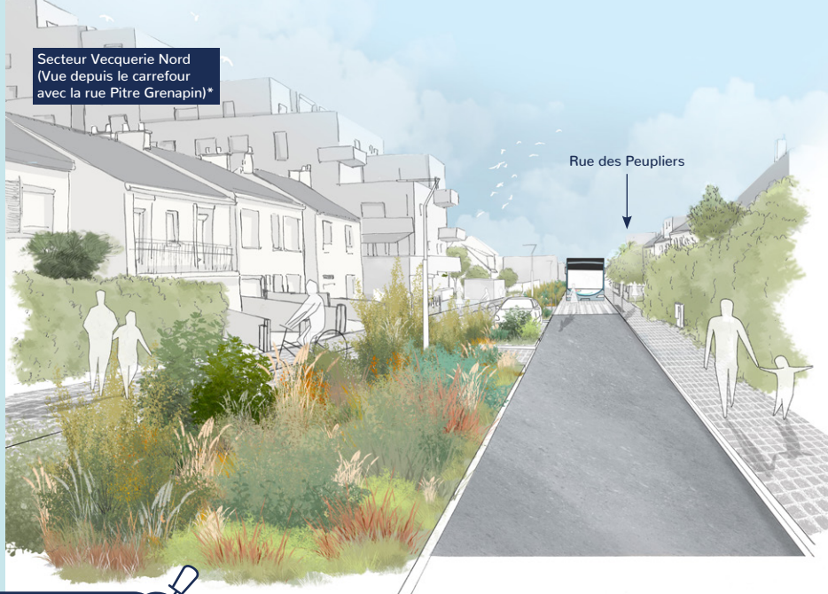
Secteur Vecquerie Nord (Vue depuis le carrefour avec la rue Pitre Grenapin)*

Connectant directement le quartier au centre-ville et au littoral, le projet propose également le réaménagement des traversées Nord-Sud pour faciliter, à pied ou à vélo, les déambulations entre les quartiers et l'accès au littoral. Avec héliYce+, la route de la Côte d'Amour va devenir un boulevard urbain, constitué d'espaces publics végétalisés et embellis.