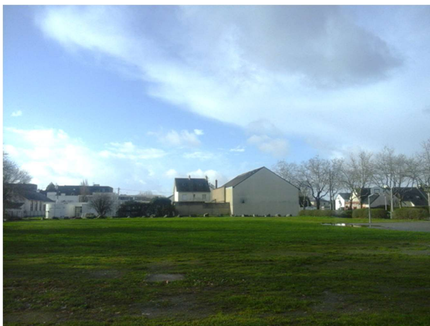
Terrain communal dédié à la future opération immobilière

Surface totale du terrain d'assiette = 3 009 m 2 y compris l'emprise de la voie nouvelle de 519 m 2